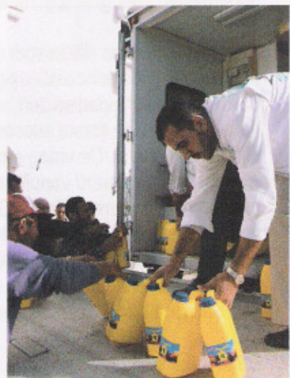
voedselverstreking Beit Hanoun

Ook hebben ze zich ingezet bij de distributie van voedselpakketten en rugzakken met Eerste Hulp materialen, die door de noodhulp van ICCO konden worden aangeschaft.